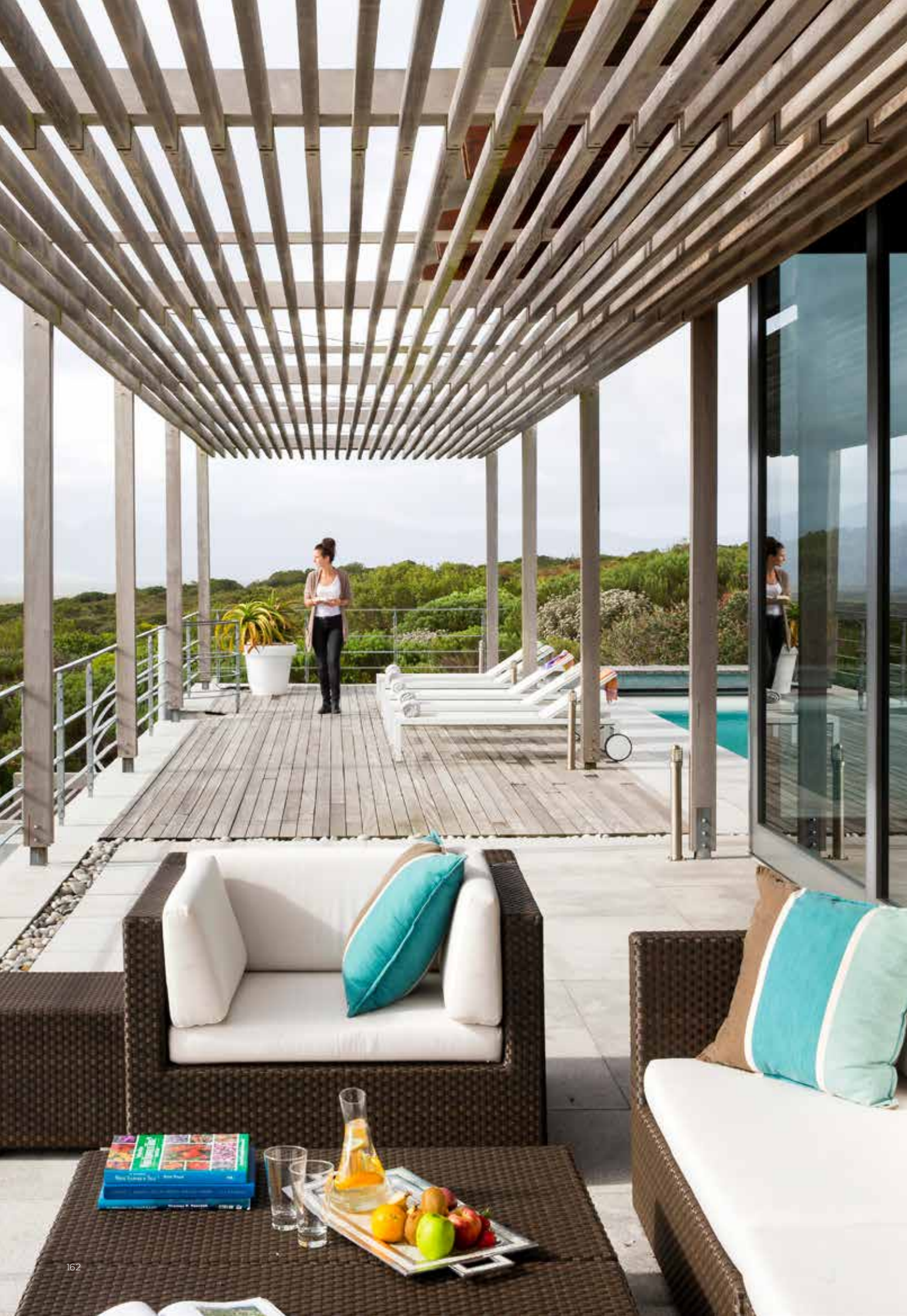
Bij het zwembad staan ligstoelen van MBM Garden Furniture en zitmeubels van Dedon. De kussens komen uit de boetiek van Grootbos. Ook de twee kuipstoeltjes zijn van Dedon.