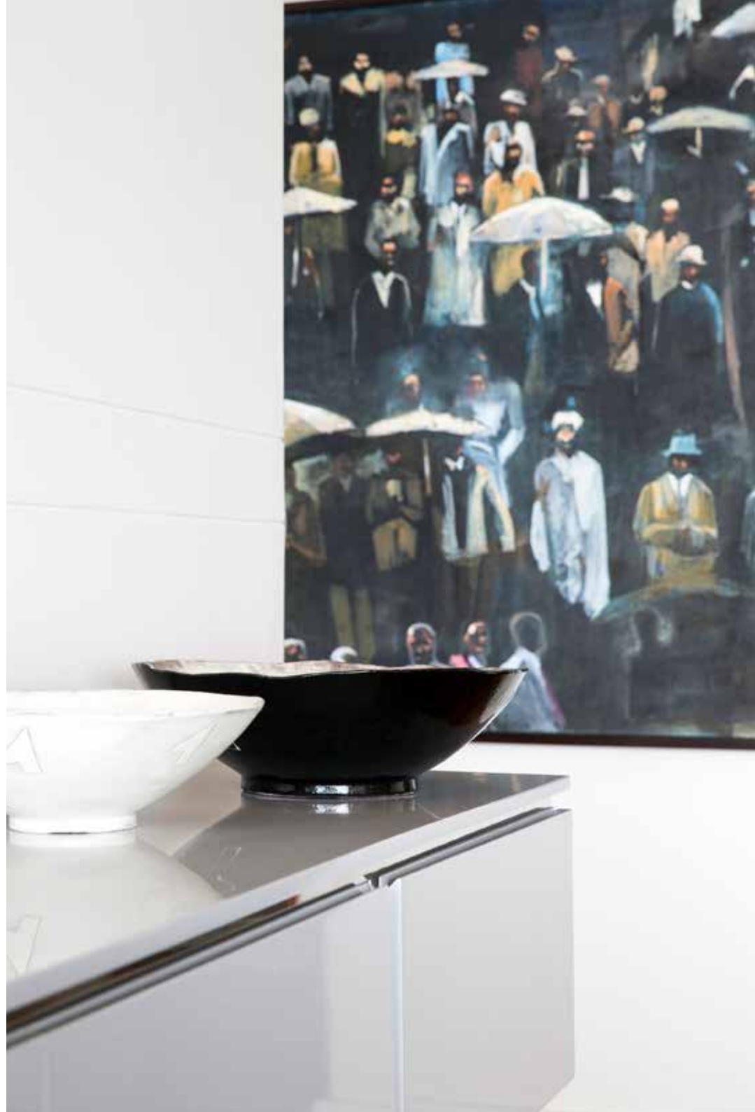
De schalen in de keuken zijn van Imiso Ceramics uit Kaapstad. Het kunstwerk aan de muur is van Cecil Skotnes.

“ De villa heeft zes elegante suites, allemaal met uitzicht op Walker Bay en de oceaan