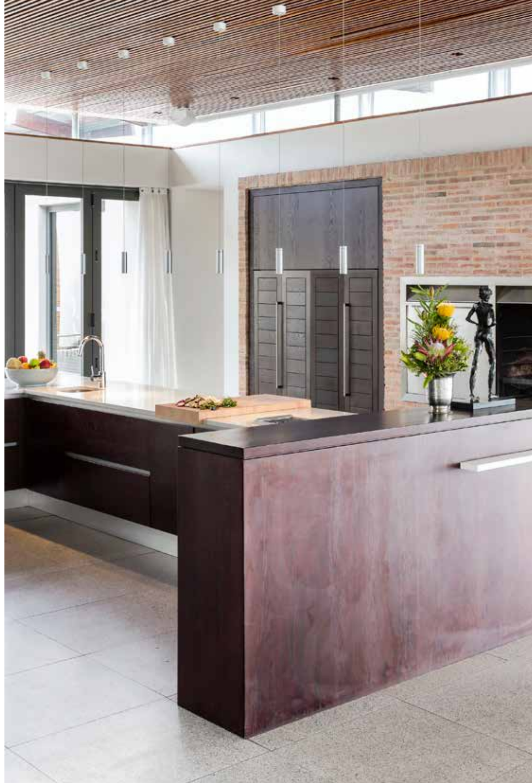
Een kijkje in de strakke en functionele keuken, speciaal ontworpen voor de villa door Fluid Architecture. De houthaard van Jetmaster flakkert vrolijk.