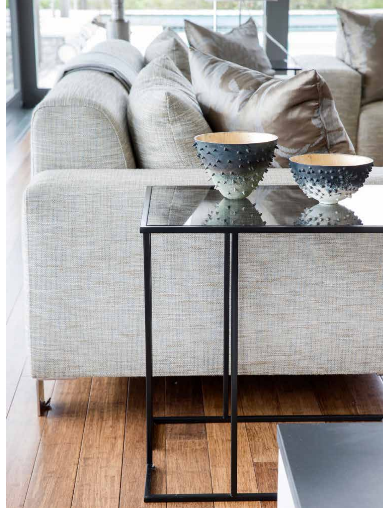
De kommen op het bijzettafeltje zijn van Imiso Ceramics uit Kaapstad.